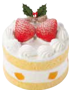
小さいいちごのショートケーキ 1,700円+税 直径約10.5cm

あっさりとしたホイップクリームと黄桃をサンドしたかわいいうちごのケーキ。少人数でのクリスマスにおすすめします。