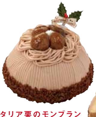
イタリア栗のモンブラン 2,500円+税 直径約12cm

イタリア栗をクリームやペーストにもふんだんに使用したちょっと贅沢で風味豊かなモンブランです。