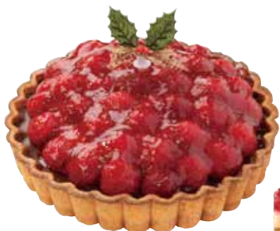
真っ赤なベリーのタルト 2,400円+税 直径約15cm

いちごのショートケーキとチョコレートケーキのふたつの人気ケーキを HALF & HALF で。迷ったらこちらをどうぞ!