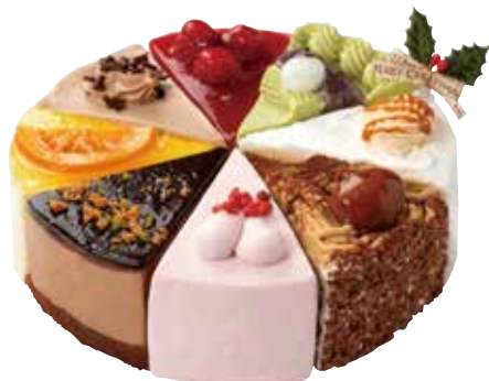
Xmasファミリーアソート 2,980円+税 直径約18cm

苺クリーム/チョコムース/オレンジチーズ/チョコ/ベリームース/抹茶/カラメル/マロン... なかよく家族で!