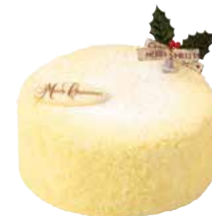
2層のチーズケーキ 1,800円+税 直径約12cm

ベイクドチーズケーキの上にレアチーズケーキを重ねました。濃厚なコクとなめらかな口どけが上品に溶けあいます。