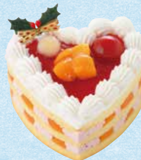
豆乳クリームケーキ (特定原材料不使用) 2,750円+税 約12cm(ハート型)