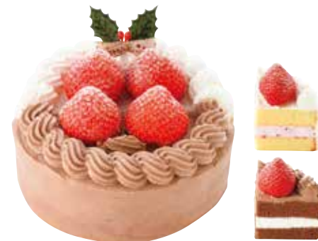
いちごとチョコの HALF & HALF 2,400円+税 直径約12cm

いちごのショートケーキとチョコレートケーキのふたつの人気ケーキを HALF & HALF で。迷ったらこちらをどうぞ!