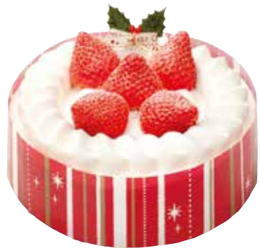
いちごのケーキ 2,900円+税 直径約15cm

しっとりとしたスポンジケーキに、黄桃&パインとホイップクリームをサンド。クリスマスの定番です。