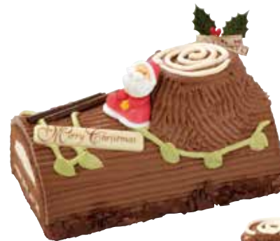
ブッシュドノエル 2,600円+税 約9×約15.5cm

苺クリーム/チョコムース/オレンジチーズ/チョコ/ベリームース/抹茶/カラメル/マロン... なかよく家族で!